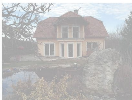
Idyllisches freistehendes Einfamilienhaus - Kalchreuth Baujahr 2005, Wohnfläche ca. 145 m 2 , Grundstück 818 m 2 , Einbauküche, Fußbodenheizung, Kamin, Doppelgarage, Bezug ab sofort, V, 87,2 kWh/(m 2 a), Holzpellets, C 645.000,- €