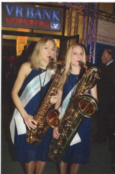
Hübsche Saxophon-Musikerinnen wandelten beim Empfang „spielend“ durch die Gästeschar.