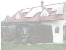
Top gepflegtes Einfamilienhaus - Thalmässing Baujahr 2002, Wohnfläche ca. 171 m 2 , Grundstück 727 m 2 , Wintergarten, Einbauküche, Kamin, Solar, Photovoltaik, Doppelgarage, B, 120 kWh/(m 2 a), Strom, Energieeffizienzklasse D 445.000,- €