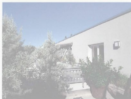
Penthauswohnung - Grundigpark, Fürth Wohnfläche ca. 158 m 2 , Baujahr 2015, Dachterrasse, Einbauküche, Fußbodenheizung, elektr. Rollläden, Aufzug u.v.m., B, 39,3 kWh/(m 2 a), Gas, A 646.000,- €