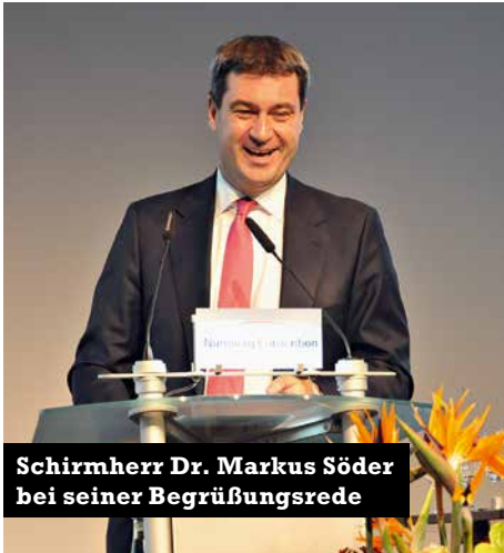
Schirmherr Dr. Markus Söder bei seiner Begrüßungsrede