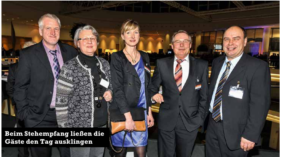
Beim Stehempfang ließen die Gäste den Tag ausklingen