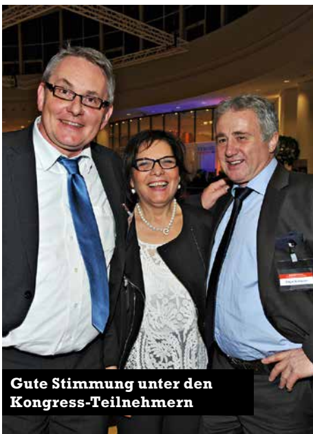
Gute Stimmung unter den Kongress-Teilnehmern